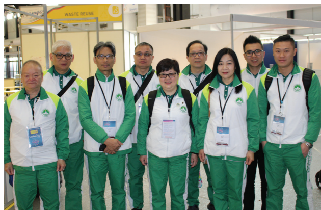
第九屆國際殘疾人士技能大賽 澳門參賽選手名單