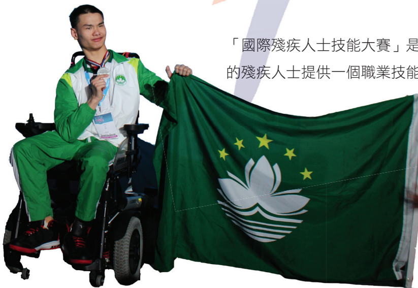
明愛通訊 第120期 01

澳門明愛組織中國澳門代表團3月下旬前往法國波爾多參與這國際賽事，今屆有49個比賽項目，35個國家和地區的代表隊、約520名選手參賽。澳門代表團一行40多人，共參加了16個賽項。