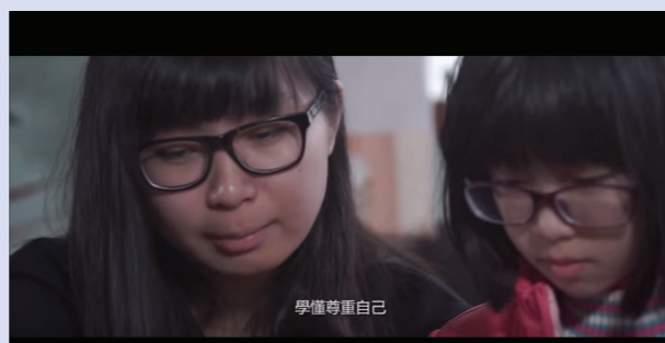
《不一樣的上門服務》